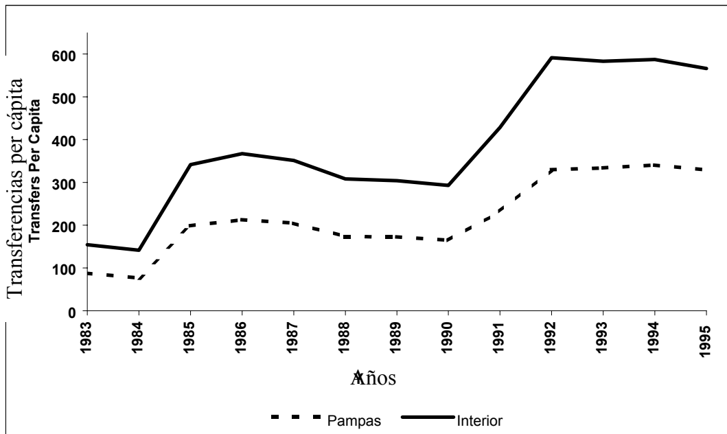
Figura 1: Recursos de la coparticipación federal de impuestos transferidos a los gobiernos de las provincias en Argentina (1983-1995) (transferencias promedio per cápita entre provincias)

Fuente: Basado en datos recopilados de la Subsecretaría de Asistencia a las Provincias y la Dirección Nacional de Coordinación Fiscal con las Provincias.